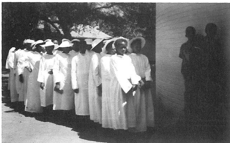
Konfirmation i Gaborone församling.

Till flyktinglägren fick inte representanter för de kristna kyrkorna tillträde. Vi kunde alltså inte bedriva någon andlig verksamhet där, varken genom att ordna gudstjänster eller att besöka enskilda interner i självvårdande syfte. Särskilt gällde detta lägret i Selebi-Phikwe. Flyktingar som vi talade vid när de någon gång kunde få permission