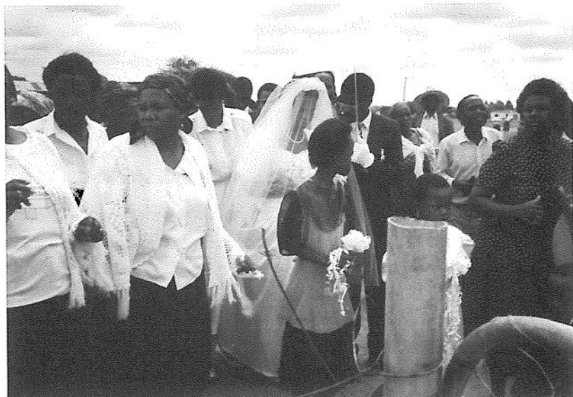
Bröllopsbild från Garborone. Brudparet välkomnas till brudgummens hem.

En annan gång fick jag brev från evangelisten i en församling långt bort (50 mil!). Han hade fått stopp i sin toalett och nu ville han att jag skulle komma och klara upp eländet åt honom! Själv kunde han ju inte förväntas göra något sådant!