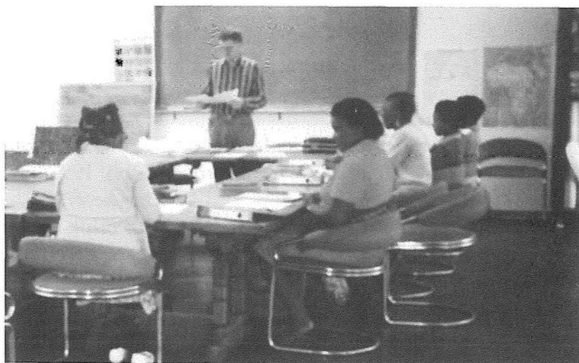
Lektion i stora salen i Woodpecker prästseminarium som också används för kurser för utbildning av söndagsskollärare och andra medarbetare i församlingarna.

i september 1987 att en missionär skulle utses till den posten. Detta ledde till att jag valdes som kyrkans förste generalsekreterare med tillträde kort tid därefter. Omständigheterna gjorde att jag därefter redan i början av år 1988 samtidigt fick ta över uppgiften som kassaförvaltare, varigenom jag också blev ansvarig för kyrkans ekonomi. Båda dessa uppgifter åvilade mig sedan fram till maj 1991, då Tyyne och jag avslutade vårt arbete i den lutherska kyrkan i Botswana. Det blev några intensiva år, inte minst därför att jag utöver mitt ordinarie arbete också ibland behövde åta mig uppgifter i församlingen. Vissa tider hade jag alltså att svara både för kyrkans administration och ekonomi och dessutom ta hand om församlingen i Gaborone med dess gudstjänster. När det gäller de två förstnämnda uppgifterna har man hittills tyvärr inte kunnat finna någon lämplig inhemsk person, som kunnat ta över någon av dem. Fram till i år har båda posterna varit besatta med missionärer. Till uppgiften som generalsekreterare utsågs nyligen E. Ndulu från Tanzania, medan kassaförvaltningen f n sköts av en tysk missionär, Reinhard Eckart, från Berlinmissionen. Kyrkans läge är i detta sammanhang bekymmersamt, eftersom man har svårt att finna lämpligt folk både för utbildning till präster och till andra uppgifter. Sålunda söker man nu en missionär som kan ersätta kassaförvaltaren när denne i börja av nästa år lämnar sin tjänst. Man söker också präster för några av sina för-