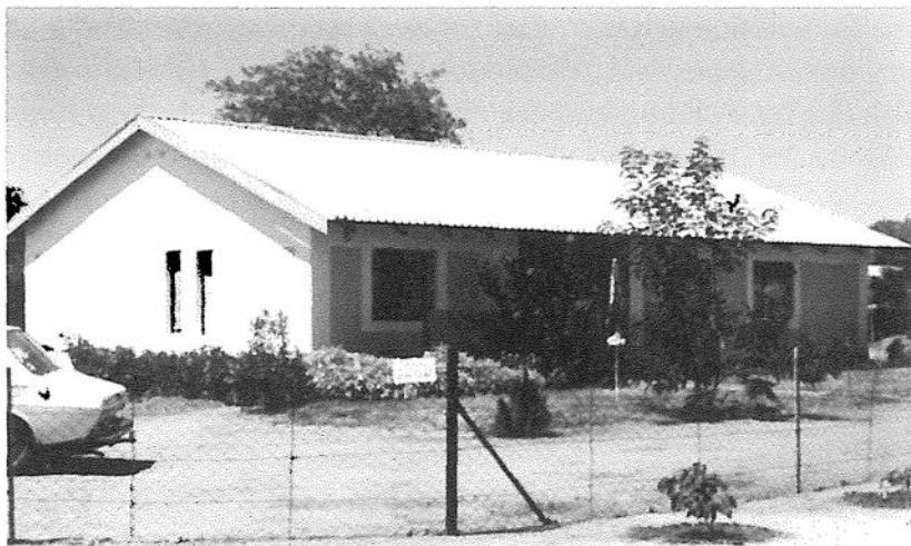
Selebi-Phikwe prästgård, byggd 1982.

vecka besökte skolor där vi höll morgonbön. Vi fick då 15 min till vårt förfogande för att på ett enkelt sätt tala om vår kristna tro och vad som hör till den. Så kunde jag t ex över en 2-årsperiod gå igenom så gott som hela katekesen vid en skola med drygt 1000 elever. Morgonbönen ingick i schemat som inledning till dagens undervisning. Den var ett slags morgonsamling, varvid eleverna stod uppställda i led, varje klass för sig och den var obligatorisk även för lärarna. Sång och en kort bön ingick i morgonbönen.