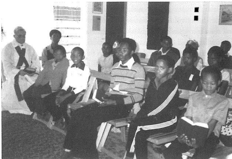
Gudstjänsterna i Selebi-Phikwe firades de första åren i prästbostadens vardagsrum, som var ganska rymligt.

Utvecklingen inom kyrkan i Botswana under 1978 ledde till att ELCB bildades mot slutet av året. I och med ELCBs tillkomst kom vi att i fortsättningen vara knutna till den inhemska lutherska kyrkan med detta namn och stod inte längre under ELCSA. Jag förbigår i fortsättningen nästan helt de frågor som hörde ihop med den utveckling som berodde på konflikten mellan ELCSA och ELCB.