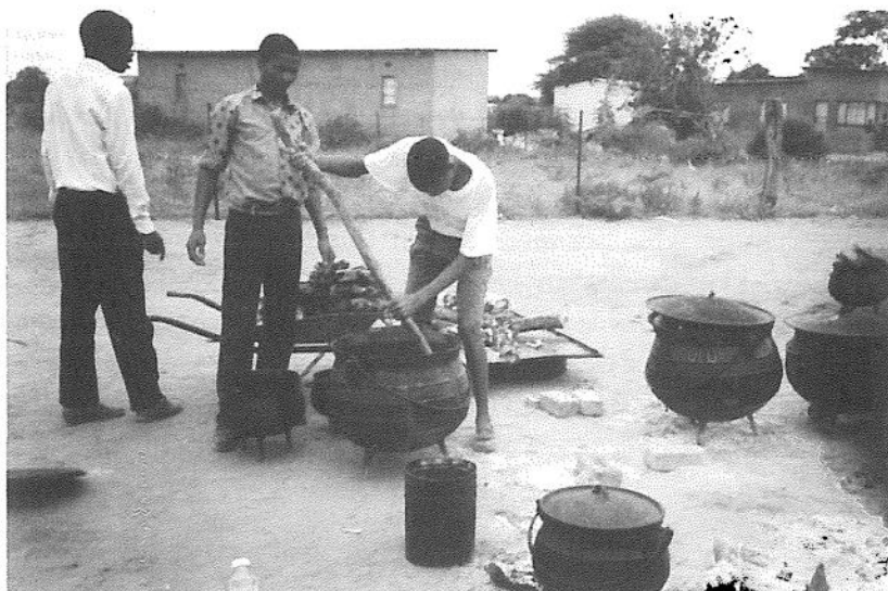
Bröllopsmåltiden tillreds för de många gästerna (hundratal).

Närmare 15 svenska mil norrut från Selebi-Phikwe ligger Francistown, som är en av de äldsta städerna i Botswana. Staden grundades i slutet av 1800-talet, när järnvägen genom Botswana till nuvarande Zimbabwe byggdes. Under åren då vi arbetade i Selebi-