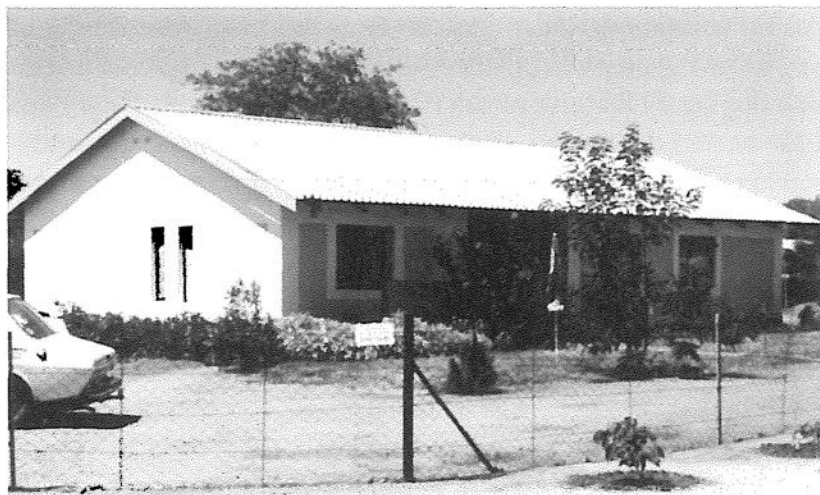
Selebi-Phikwe prästgård, byggd 1982.

vecka besökte skolor där vi höll morgonbön. Vi fick då 15 min till vårt förfogande för att på ett enkelt sätt tala om vår kristna tro och vad som hör till den. Så kunde jag t ex över en 2-årsperiod gå igenom så gott som hela katekesen vid en skola med drygt 1000 elever. Morgonbönen ingick i schemat som inledning till dagens undervisning. Den var ett slags morgonsamling, varvid eleverna stod uppställda i led, varje klass för sig och den var obligatorisk även för lärarna. Sång och en kort bön ingick i morgonbönen.