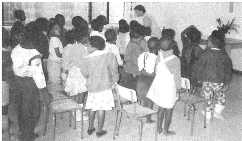
När kyrkan blivit färdig hölls söndagsskolan i församlingssalen före gudstjänsten.

endast delvis asfalterad. Ungefär halva sträckan, c:a 20 mil, var dålig grusväg med meterhöga sandvallar på båda sidor om vägen så att det var som man körde i en torr flodfåra. I mitten av vägen låg en hög sandås som man kunde bli hängande på med bilen om man inte såg sig för. Det hände oss en gång att vi verkligen blev hängande på en sådan sandbank, så att bilen inte kunde fortsätta. Då fick vi uppleva något av "änglahjälp". Inom två minuter kom en fyrhjulsdriven större bil och hjälpte oss loss. Detta hände två gånger på samma väg, innan vi kom fram dit vi skulle. Selebi-Phikwe var då en ung stad, grundad i slutet av 1960-talet, när nickel- och koppargruvan öppnades. Redan efter tio år hade invånarantalet stigit till c:a 30.000. Många av gruvarbetarna bodde i enkla ruckel i slumliknande förstäder, där de inte behövde betala dyra hyror, vilket de annars måste göra, för hyrorna i Botswana var mycket höga. I slumområdena fanns varken gatunamn eller riktiga gator eller vägar, utan man fick ta sig fram mellan husen så gott det gick. Det enda sättet att finna vägen till någons bostad var därför att någon, som kände till var en person bodde, visade vägen. Det låg burkar, plast och annat skräp nästan överallt och ingen brydde sig om att samla upp det. I det fallet var slumområdena i Selebi-Phikwe inget undantag från andra städer i Botswana för 20 år sedan.