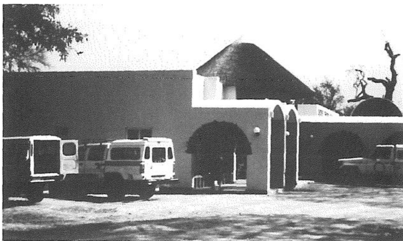
Huvudbyggnaden vid Thuso handikappcenter, invigt 1989 av landets president.