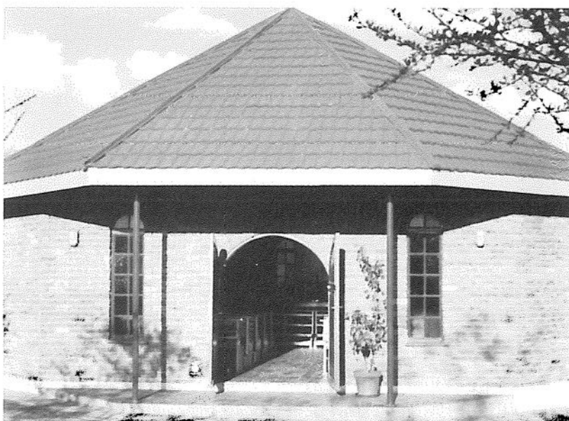
Seminariets kapell. Klockstapel finns, som dock ännu saknar klocka.

och de båda kyrkorna ELCB och ELCSA. Sjukhuset har mycket gott anseende och många föredrar missionens sjukhus framför det stora statliga sjukhuset i Gaborone. Där finns både BB-avdelning, TBC-avdelning, en avdelning för döva (dövstumma) och medicinsk och kirurgisk avdelning. Sammanlagt har sjukhuset plats för ett hundratal inneliggande patienter. Antalet klinikpatienter är därtill mycket stort. Tidigare drev kyrkan en sjukstuga i Sehitwa i nordvästra Botswana, där tyska diakonissor var placerade, men sjukstugan där överlämnades för ett antal år sedan till lokala kommunala myndigheter.