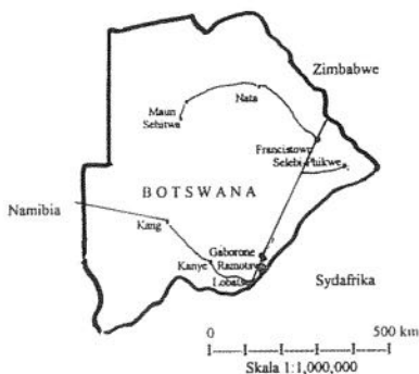
Karta över Botswana.

I början av 1978 kom vi att fortsätta vårt arbete som missionärer, men då inom den evangelisk-lutherska kyrkan i Botswana. Om kyrkan och missionen i Botswana och våra minnen därifrån skall jag nu berätta.