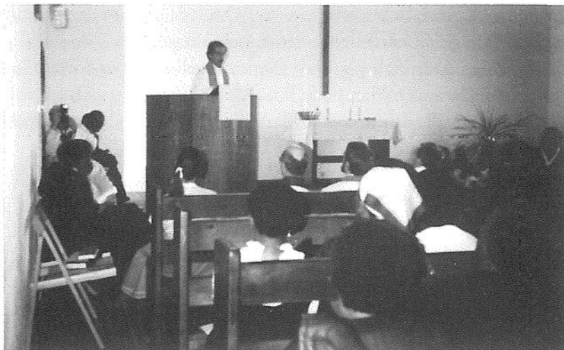
Interiör från kyrkan i Francistown